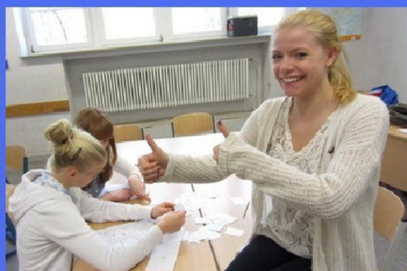
Und während in der Aula ein buntes Europa-Musik- und Tanzprogramm ablief, besuchten die Schüler der Jahrgangsstufen 5-8 die Europa-Lernstationen im Hauptgebäude.