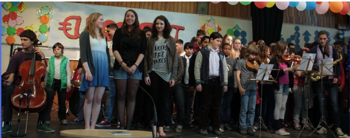
Gemeinsam auf der LfG-Bühne: Projektband, Instrumentalkreis und Integrationsklassen musizieren Xavier Naidoos "Was wir alleine nicht schaffen, das schaffen wir dann zusammen ..."