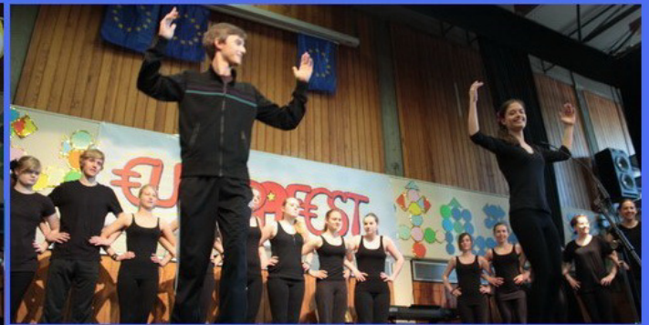
Europa tanzt: Schottischer "Big Circle Dance" (Klasse 5c) und Folkloretanz vom Balkan (Tanzkurs der Jgst. 11).